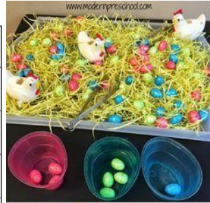
Chicken Eggs Sensory Tray Color sorting + fine motor fun in preschool!